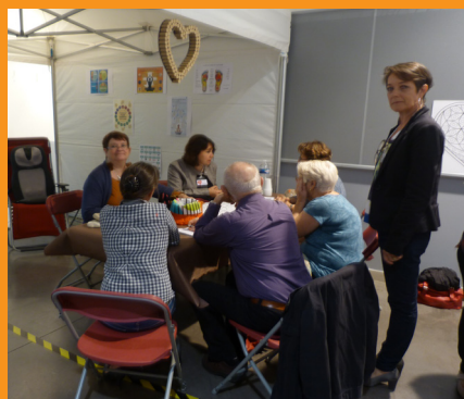
Journée Nationale des Aidants 2016

Nous comptons sur vous ! C'est l'occasion de participer à ce mouvement pour que l'aide à un proche devienne un véritable sujet de société.